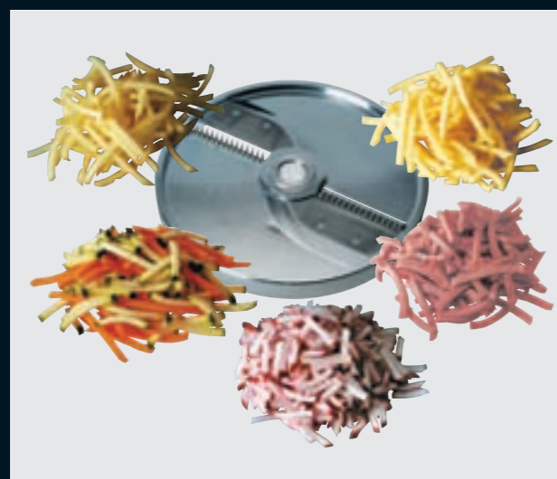
(PA) Allumettes Fiammiferi