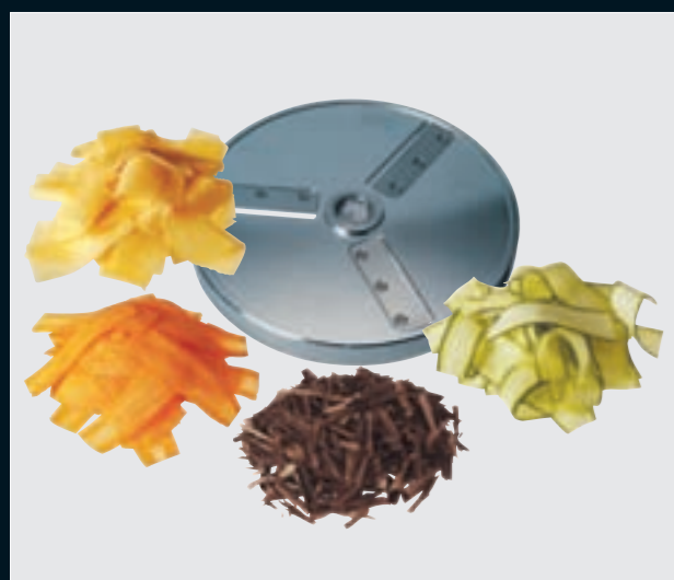
(HS) Hobelschnitt • Coupe ultrafine Shaving cut • Affettaverdura