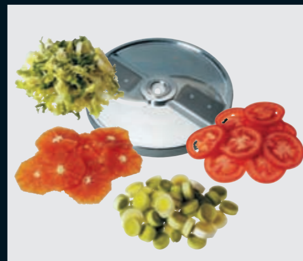
(TO) Tomatenschnitt • Coupe tomates Tomato slicer • Taglio pomodori