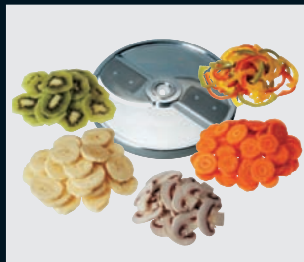
(G) Grobschnitt • Tranches épaisses Coarse cut • Taglio grosso