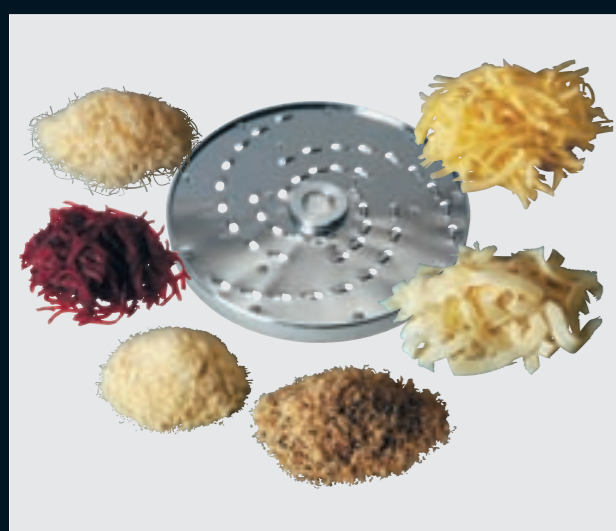
(RS) Raffel • Râpe • Shredder • Grattugia