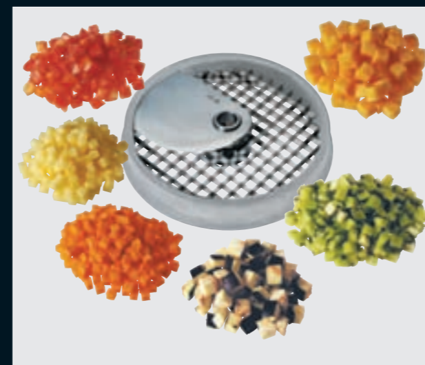
(W) Würfel • Cubes • Cubetti