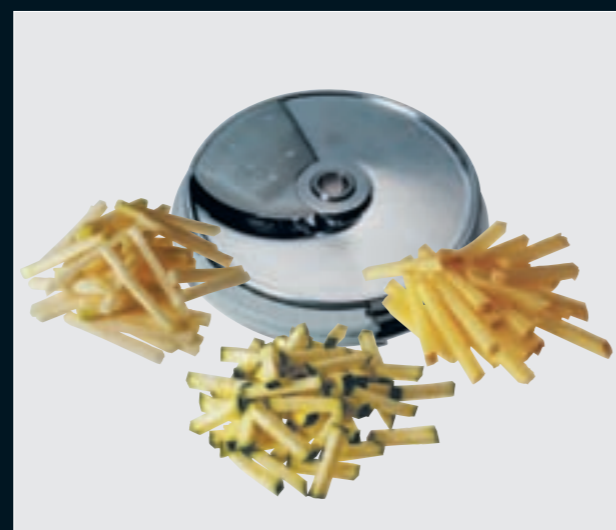
(BT) Bâtonnets French fries • Bastoncini