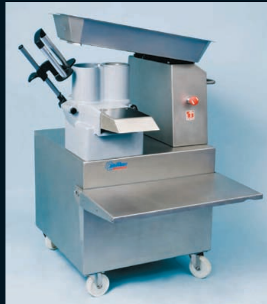
anliker GSM Multicut 240