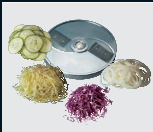
(F) Feinschnitt • Tranches fines Fine cut • Taglio fine