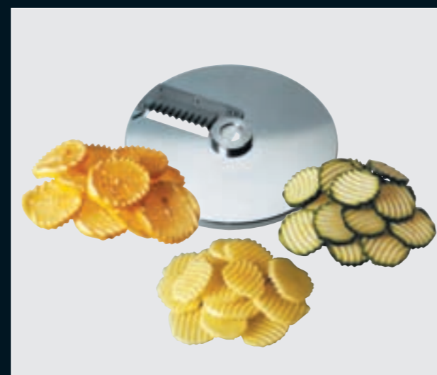
(SU) Demidov Wave cut